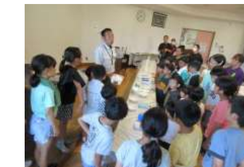
7/23(火) 夏休みこども教室「高専出張講座」