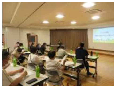
6/21(金) リサイクル協力員研修会