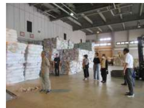
7/17(水) リサイクル協力員視察研修