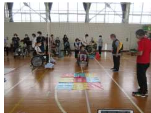
6/26(水) スポーツ体験交流研修会