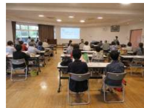
7/1(月) まるごと元気研修会