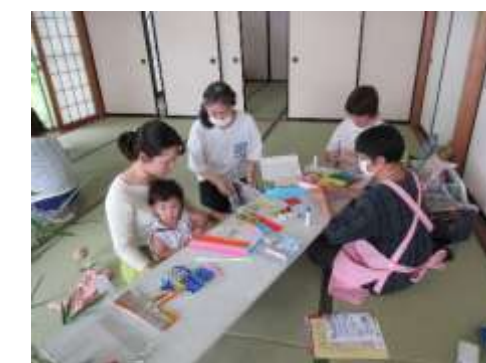
7/18(木) こうまっこ教室