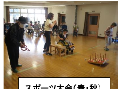
スポーツ大会(春・秋)

生馬地区寿会では、「健康で楽しく暮らす」ためにスポーツやボランティア等、いろいろな活動を自主的に実施しています。一緒に活動して親睦の輪を広げていきたいと思います。たくさんの方の入会を心からお待ち申し上げます。