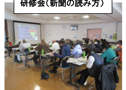
研修会(新聞の読み方)