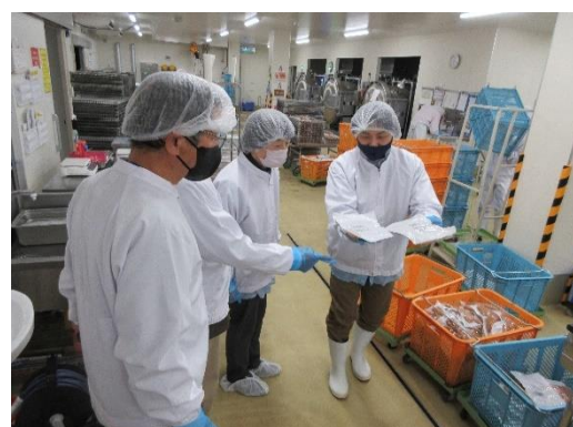
モルツウエル株式会社(高齢者用配食サービス)