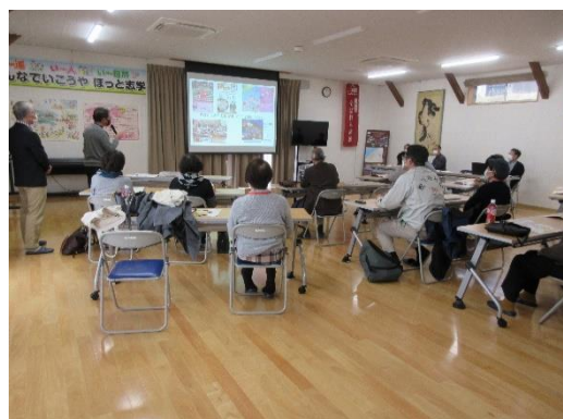
大田市志学コミュニティセンター(防災学習)