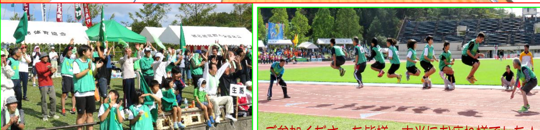
ご参加くださった皆様、本当にお疲れ様でした☆