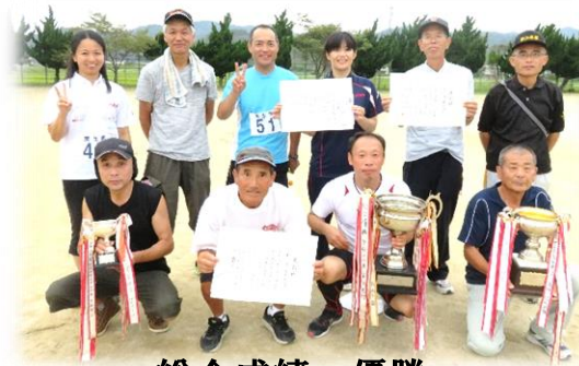
総合成績 優勝 東生馬町内会