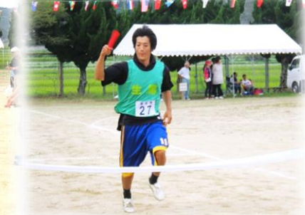
年齢別リレー 優勝 東生馬町内会