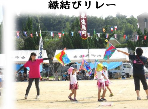
生馬幼稚園による演技