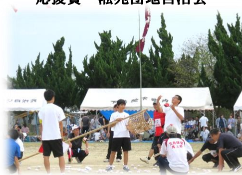
一中生ボランティア活動の様子