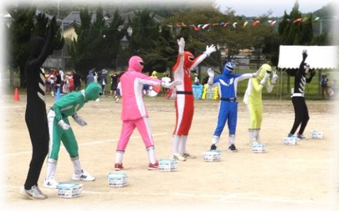
検診受診PR 一中生ボランティアによる「4代目 生馬地区健康戦隊ケンシンジャー」