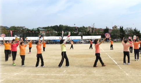
応援賞 淞苑団地自治会