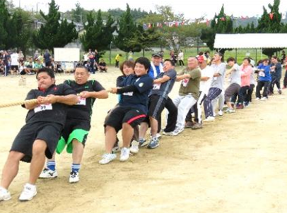
綱引き優勝 浜佐田灘町内会(14連覇)