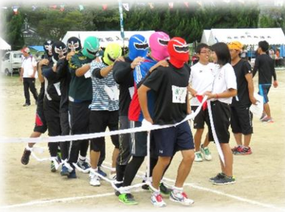
むかで競走 優勝 薦津町内会