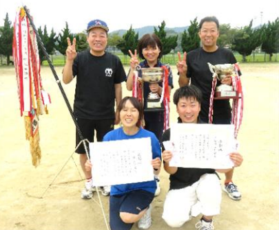
第63回町民体育大会 優勝 上佐陀町内会