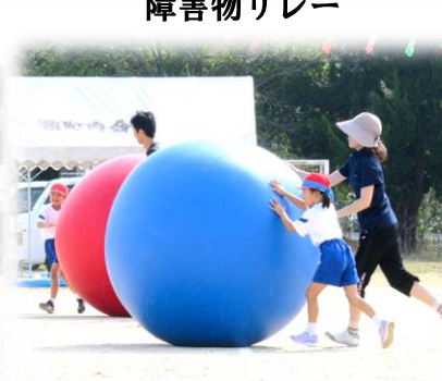
生馬小学校による競技