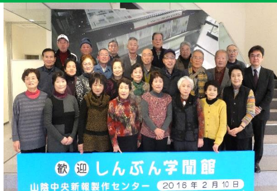
歓迎 しんぶん学問館 山陰中央新報製作センター 2016年2月10日