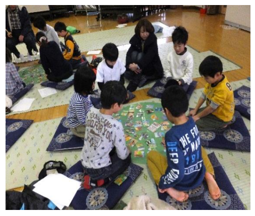
真剣勝負! 集中... 集中...