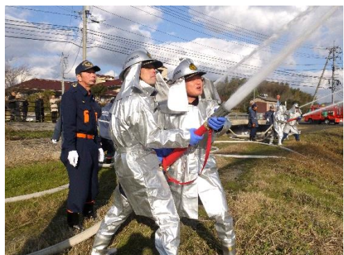
1/10(土) 消防生馬分団による一斉放水