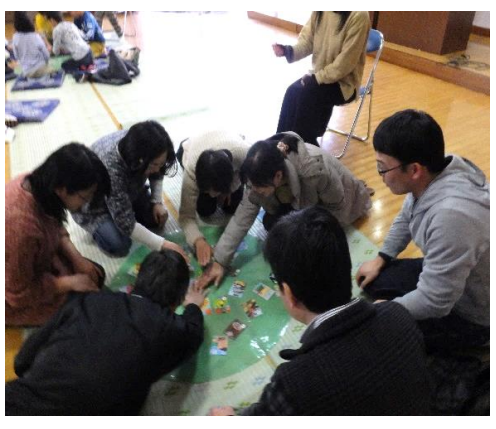
保護者だけで本気でやりました!