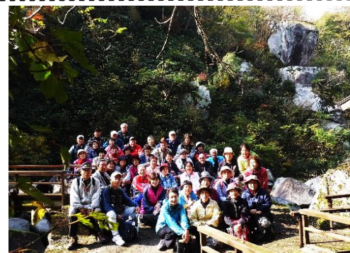
第7回いきいきウォーキング報告 11/19(水) 鬼の舌震い[右上:ハンド岩]