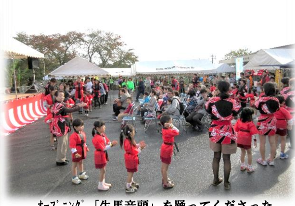
オープニング「生馬音頭」を踊ってくださった生馬幼稚園児と名尾が丘踊りの会の皆さん