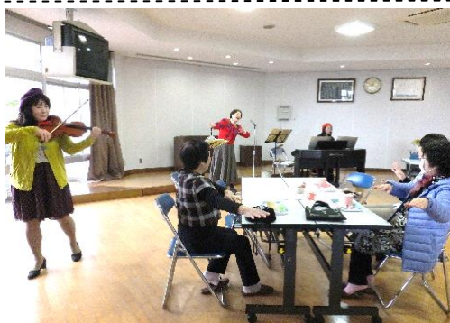
第3回いくまカフェ報告 11/13(木) ピアノとバイオリンと歌の生演奏