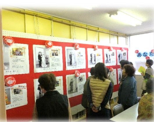
町自連「企画展」コーナー