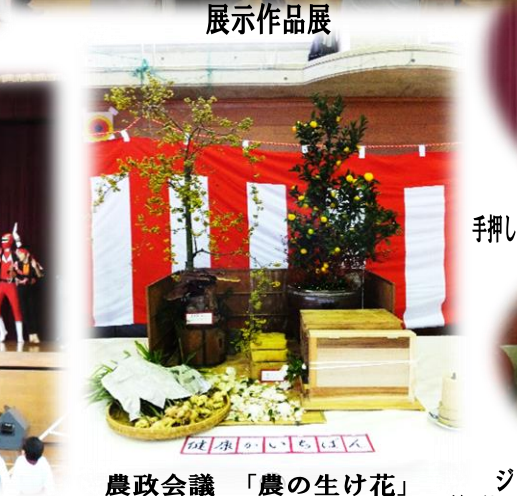
農政会議「農の生け花」優勝 下佐陀町上町内会