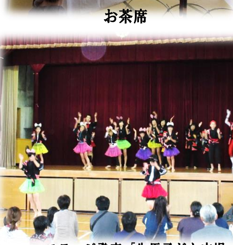
ステージ発表「生馬子ども広場」