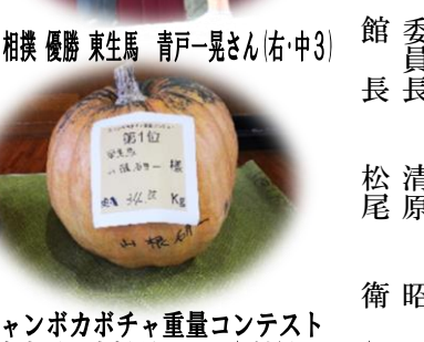
ジャンボカボチャ重量コンテスト 第1位 東生馬 山根研一さん(重量34.75kg)