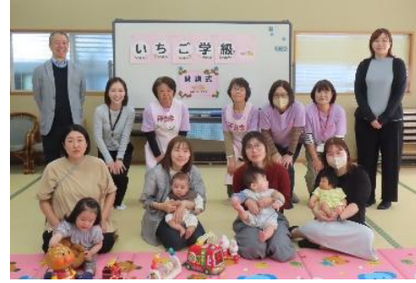
5/11 いちご学級【開校式】