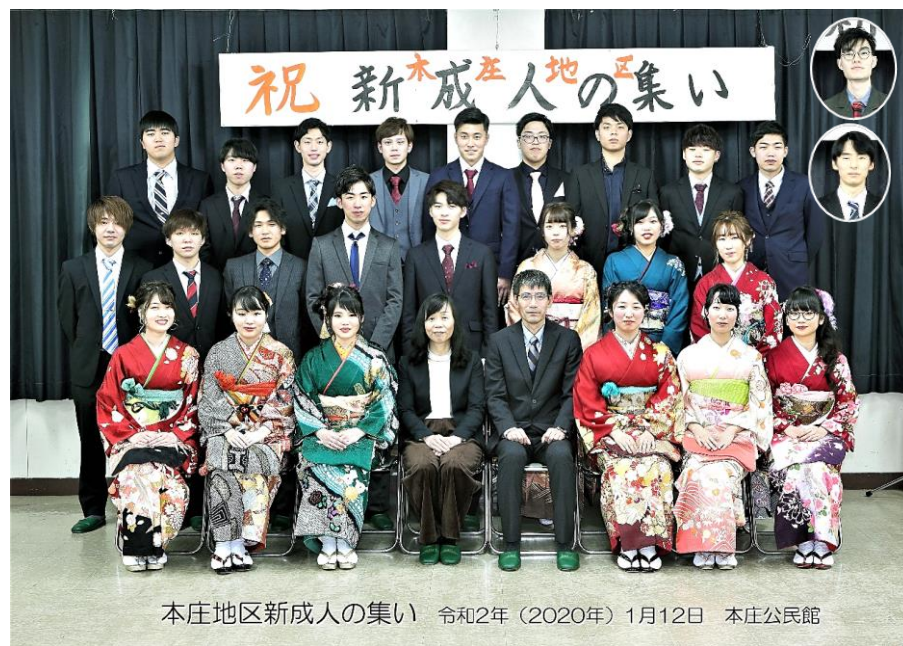
本庄地区新成人の集い 令和2年(2020年)1月12日 本庄公民館