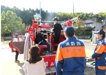
法吉分団ポンプ車両 展示