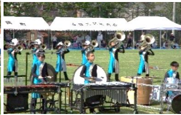
記念行事 立正大学湘南高等学校 マーチングバンド部演奏