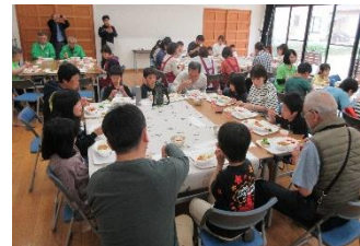
第1回だれでも食堂ほっき