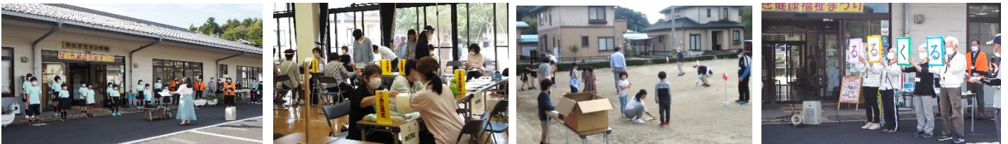
オープニング「法吉小おんぶクラブ」

10月15日(土)三年ぶりとなりました「第5回ほっき健康福祉まつり」を開催しました。当日は、晴天に恵まれ320名の皆様にご来場いただきました。地域住民の皆様健康コーナーでの健康チェックはもちろん、各コーナーを通じて自分のからだや健康づくりそして福祉への関心をより深めていただける機会となりました。前日・当日とご協力いただきました皆様、心より感謝申し上げます。今後ともよろしく申し上げます。