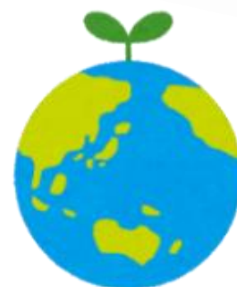
一中生作成のリーフレット