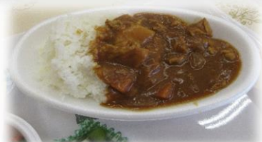
とってもおいしい大盛りカレーライス