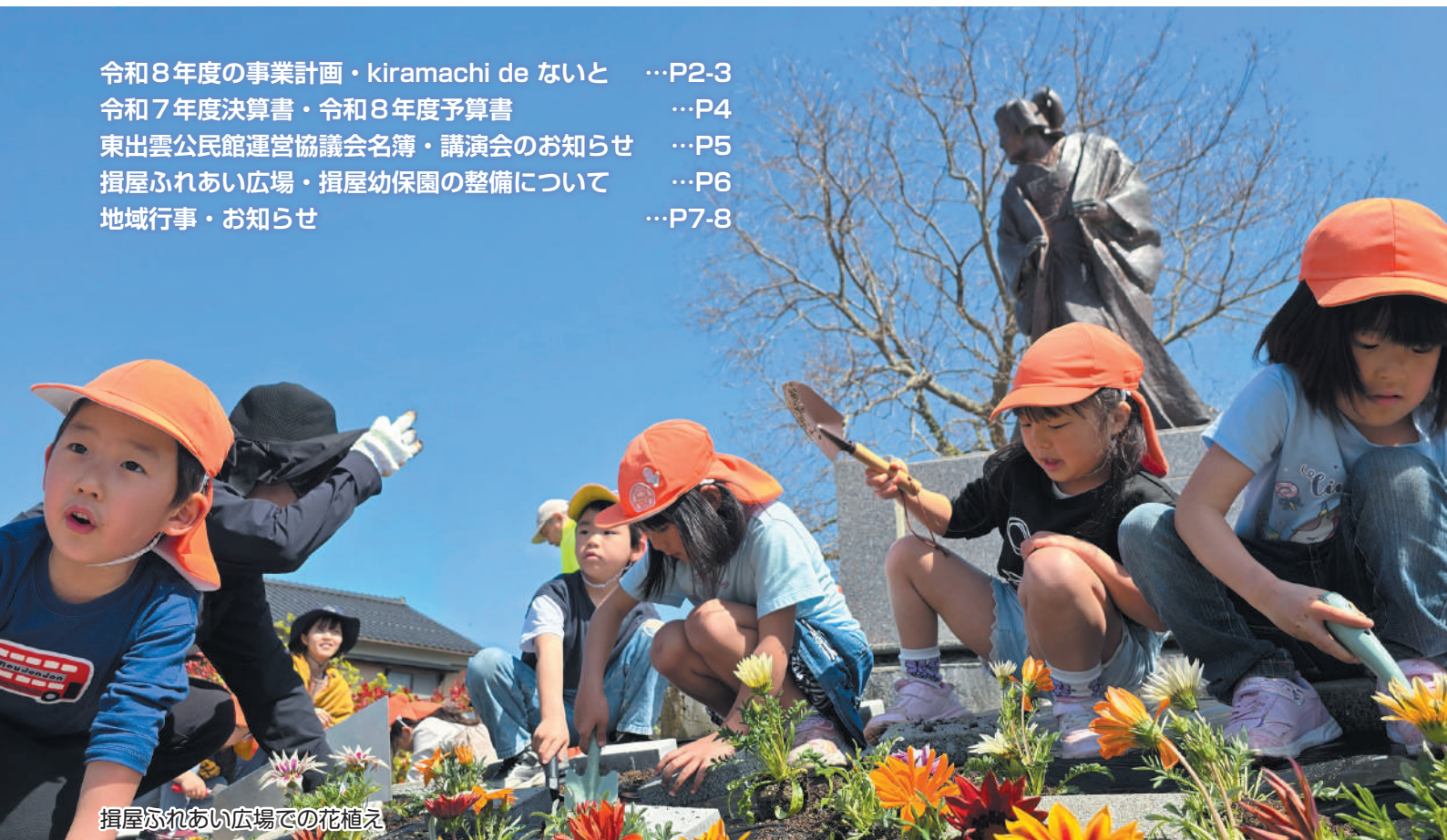
揖屋ふれあい広場での花植え