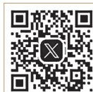
松江市子育て支援 X