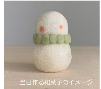
当日作る和菓子のイメージ