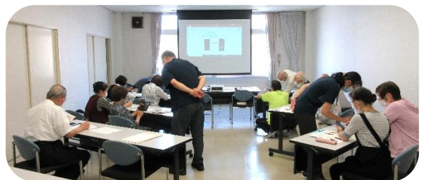
前回のスマホ教室の様子