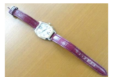
ベルトがワインレッド色のSEIKOの腕時計です

たより2月号に掲載しました忘れ物の保管期間を6月までとさせていただきます。お心当たりがある方は公民館までお問合せください。