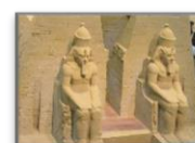
砂で世界旅行～エジプト編～

9月8日(金)に鳥取県へ社会見学に出かけました。たくさんご参加いただきありがとうございました。