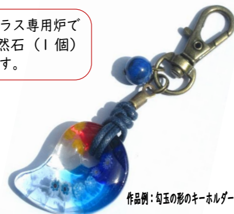
作品例：勾玉の形のキーホルダー

申込み 9月26日(金)までに朝酌公民館へ (TEL:39-0646、FAX:39-0690)