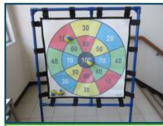
ターゲットゲーム