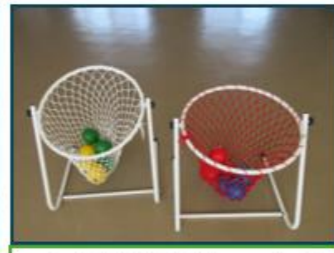
フロアバスケット