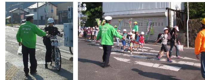
朝酌地区交通安全対策協議会

5月13日(月)地区内4か所で交通安全立哨活動を行い、登校を見守りました。また、5月17日(金)に楽山公園入口にて自転車マナーアップ街頭指導を行いました。