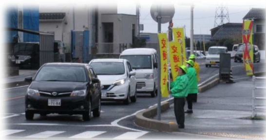
4/6 春の全国交通安全運動街頭活動実施