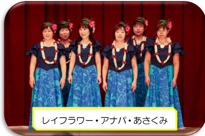
レイフラワー・アナパ・あさくみ