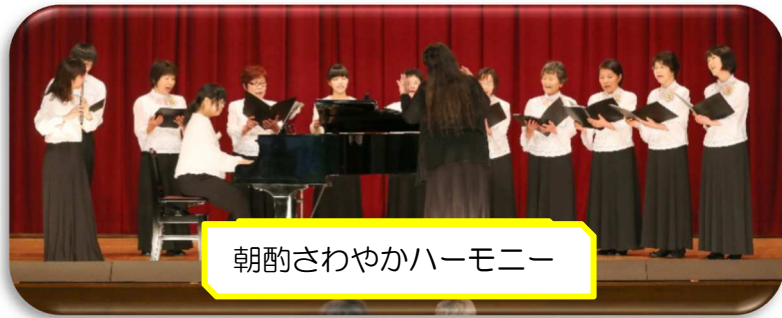
朝酌さわやかハーモニー

2月25日、八束公民館にて松東ブロック学習発表会を開催しました。朝酌地区からは、5つの教室・サークルさんが参加され、日頃の成果を披露されました。出演・出展された教室、また、たくさんの皆様のご来場ありがとうございました。