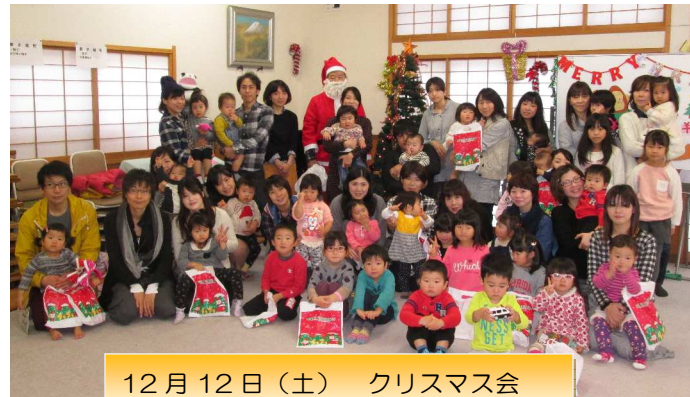
12月12日(土) クリスマス会