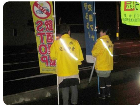
11/20、12/11に 夜光反射材着用推進活動を実施しました(西尾郷戸バス停前)

年末年始は忘新年会等で飲酒の機会が増えることから、飲酒運転による交通事故の発生や、積雪・凍結による重大事故の発生が懸念されます。危険回避、安全運転を心がけましょう。