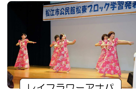
レイフラワーアナパ