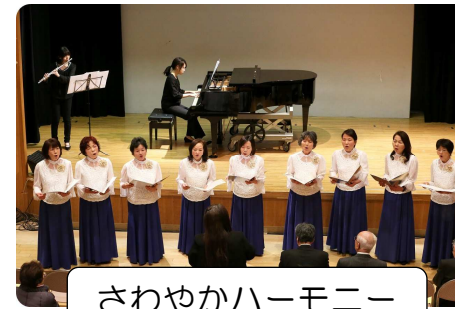
さわやかハーモニー