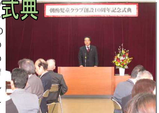
朝酌児童クラブ創設10周年記念式典

3月22日、朝酌公民館にて朝酌児童クラブの創設10周年を記念する式典が、創設時から現在にいたるまでの関係者が出席して開催されました。地域の子どものため、放課後に遊びや生活の場を提供し、その健全な育成を図るため尽力されてきた方々に感謝申し上げ、これからもクラブから子どもたちの明るい元気な声が聞こえてくることを期待します。