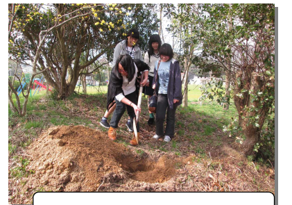
この場所、忘れないでね!

3月22日に開催しました。この春学校を卒業した朝酌地域の中学3年生が集まり、懇親昼食会をした後、将来の自分に向けたメッセージを入れたタイムカプセルを埋めました。