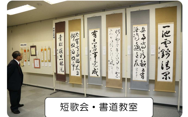
短歌会・書道教室

2月28日、川津公民館にて松東ブロック学習発表会を開催しました。朝酌地区からも5つの団体・サークルさんが出展・出演し、日頃の成果をご披露されました。多数ご来場いただきましてありがとうございました。