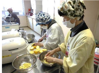
12月21日(火) 柚子みそづくり

ヘルシーぐーんとアップ講座「柚子みそづくり」では、地域の方に講師をお願いし、作り方を教わりました。喫茶あさひでは、子どもたちがウェイトレスになって注文をとったり、配膳をしたりしました。かわいい店員さんにお客さんもほっこりしていました。わんぱく教室「食育と歯科講座」では乳幼児期の正しいおやつや量や取り方、歯磨きの重要性を学びました。月齢や年齢によって違う悩みをみんなでも共有・共感することができ有意義な時間となりました。