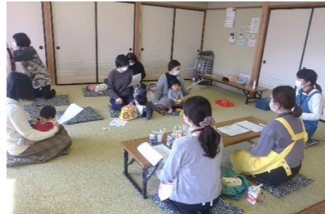
1月14日(金) 乳幼児 食育と歯科講座