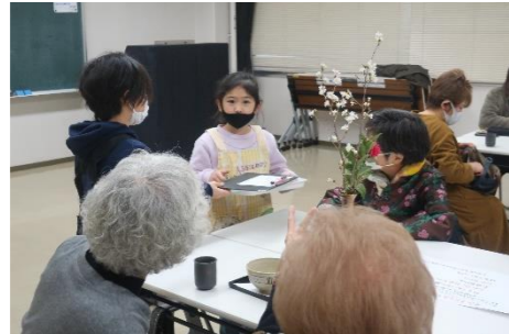
1月5日(水) 喫茶あさひ 子どもカフェ