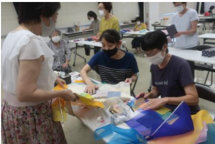
8月31日(火) 女性学級ポジャギ作り