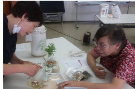
9月22日(水) ハーブティー教室