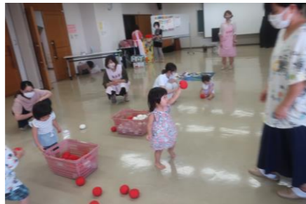
9月10日(金) わんぱく教室ミニ運動会