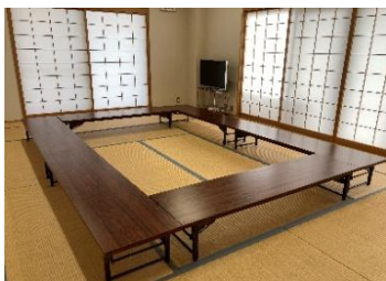
~12名 12畳 座机(6)/座椅子