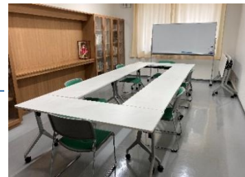
~12名 30㎡ イス(12)/ 長机(8)/ ホワイトボード