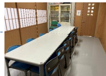
~12名 25㎡ イス(11)/机(2) ホワイトボード