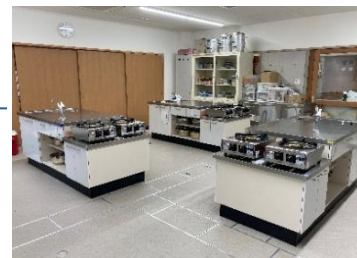
~20名 56㎡ 丸イス(16) 調理台(3)