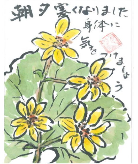
絵手紙「もみじ会」作品