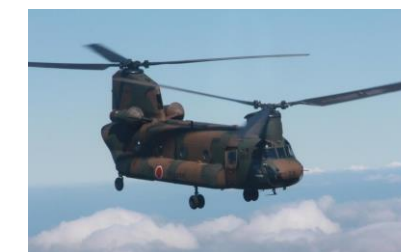
陸上自衛隊輸送用 大型ヘリコプター CH-47