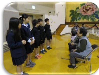
大きな声で自己紹介

八束地区社会福祉協議会では11月29日（水）一人暮らしの高齢者の方を対象とした交流事業「まめだ会」を実施しました。当日は八束学園5年生との交流や体操、ギター演奏などで楽しい時間を過ごし、お昼には食生活改善推進員による手作りのお弁当を頂き、なごやかな交流会となりました。ご協力頂きました皆様ありがとうございました。