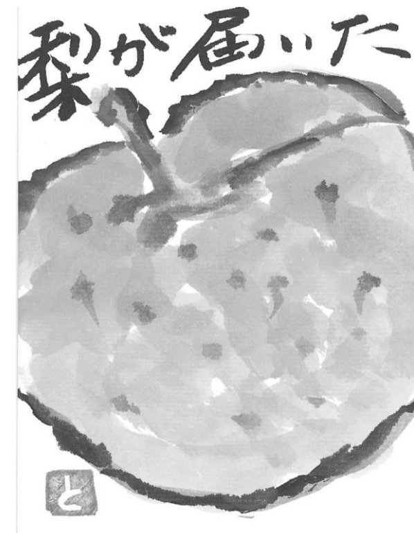
絵手紙「もみじ会」作品