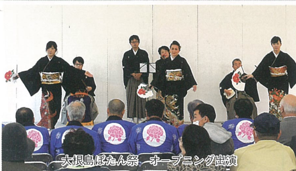
大根島ぼたん祭 オープニング出演