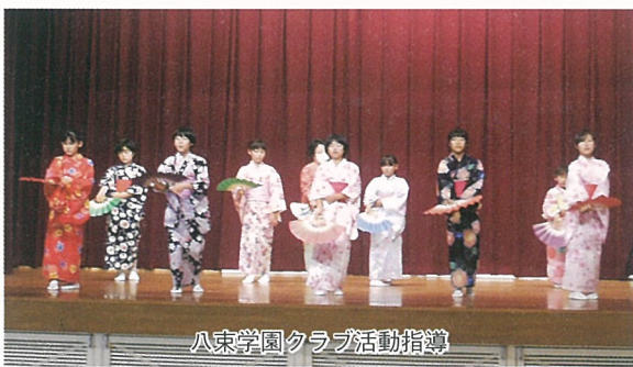
八東学園クラブ活動指導