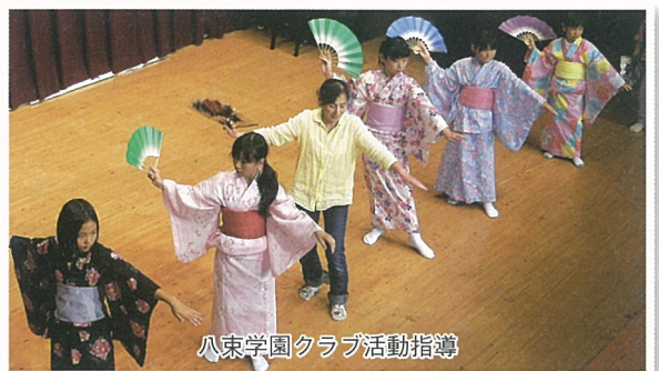
八東学園クラブ活動指導