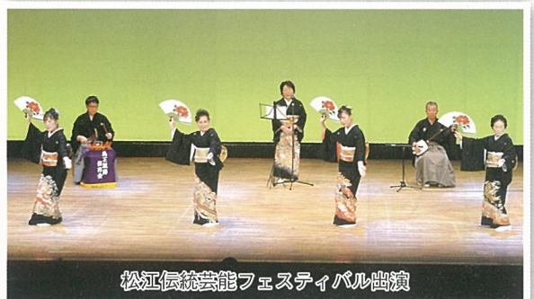
松江伝統芸能フェスティバル出演