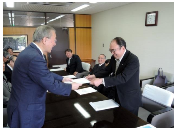
松江市長に要望書を手渡す安部会長