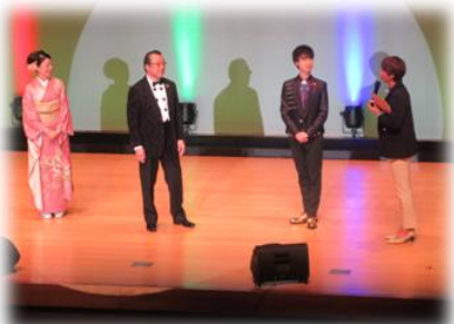
♪フジ歌手たちによる歌謡ショー