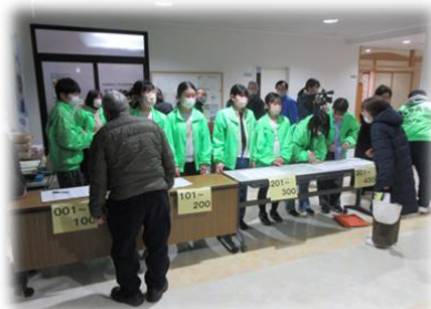
♪中学生ボランティア大活躍!