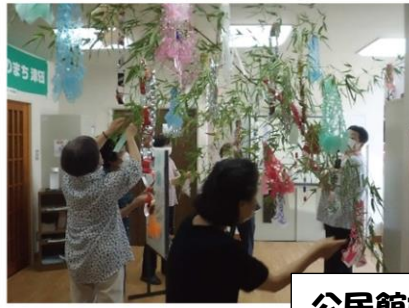
公民館前の飾りつけ