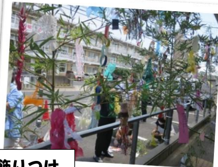
道路沿いのフェンスへ設置