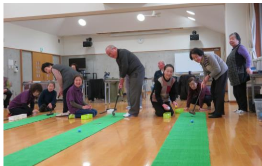
人気のRGBゲーム風景