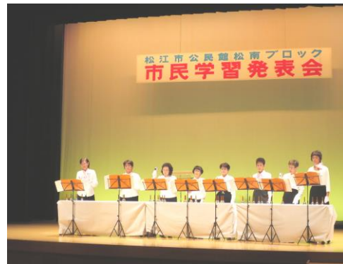
津田ミュージックベル