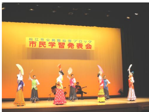
フラメンコサークル パサレーラ