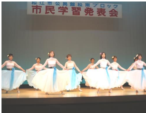
レクリエーションダンス バラの会