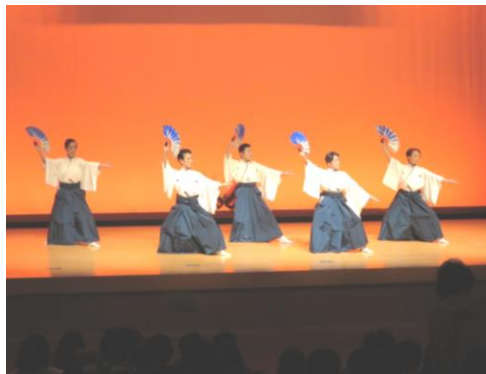
清吟堂吟友会松江ブロック 剣詩舞部