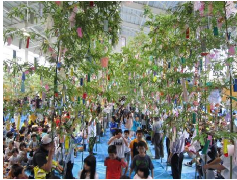
笹飾りの通り抜け