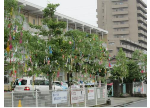
完成した七夕通り