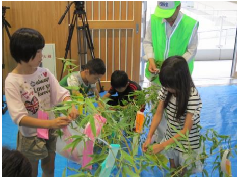
地域の方と一緒に飾り付け