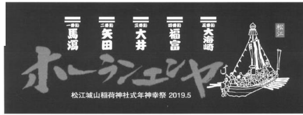
ホーランエンヤ記念タオル

松江城山稲荷式年神幸祭『ホーランエンヤ』の開催が迫りました。このホーランエンヤは、私たちの地域にとっても全国に誇れる伝統船神事です。“いーまかた”として