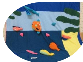
魚釣りの布おもちゃ