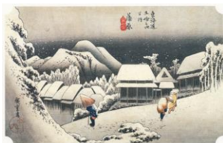
東海道五十三次之内 蒲原 夜之雪～歌川広重～