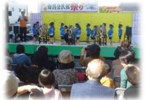
【昨年のステージ発表の様子】