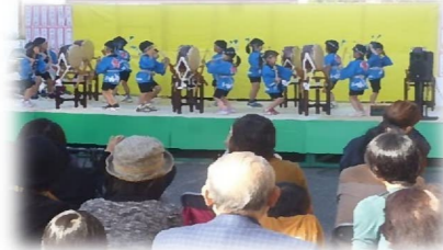
ステージイベント