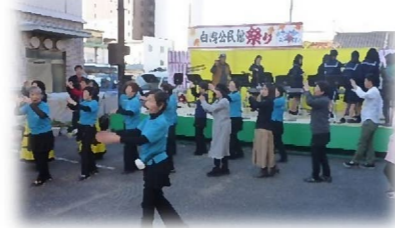
会場の皆さんと三中音頭