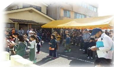
オープニングビンゴ大会

去る11月3日(土)・4日(日)「白潟公民館まつり」を開催しました。今年は天候に恵まれ、お陰様でたくさんの方にご来場いただき、盛会裏に終了いたしました。地域の多くの皆様にご協力いただきましたこと心より感謝いたします。