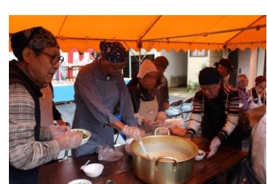
宍道湖漁協提供しじみ汁