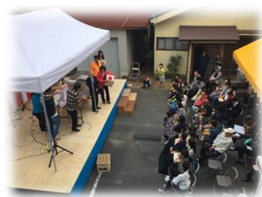
お楽しみ大抽選会