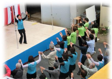
フォークダンス“白潟レイク・さざなみ教室”