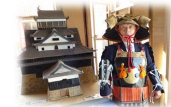
大盛況の松江城のコーナー