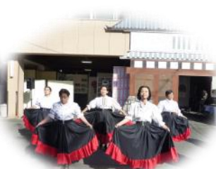
フォークダンス“さざなみ”