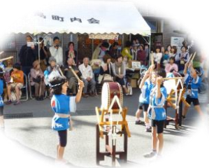
白潟保育所和太鼓