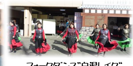
フォークダンス“白潟レイク”