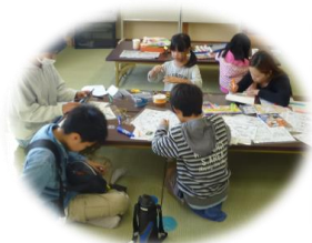
子ども体験コーナー