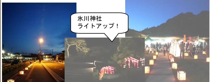
氷川神社 ライトアップ！

氷川神社の稲荷さんの鳥居もライトアップ！公民館裏庭では水燈路の中、1時間ごとにパフォーマンスステージ。室内・前庭・ロビーではニューカルフェスタさんのお店で大賑わい！また、ギャラリーCにおいて「四季を愛でる会」さんの着物の無料着付けサービスによる着物を召したお客様も風情をアシスト。天候も味方して、過去最高の人出となりました。