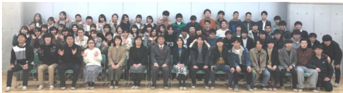
宍道町成人の集い 2019年1月3日